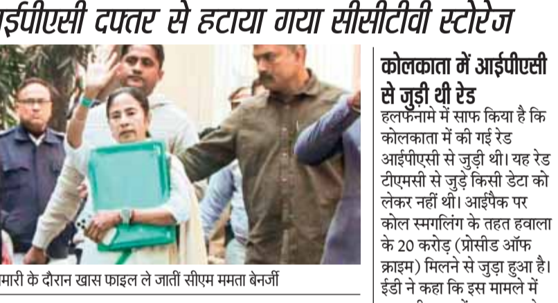
छापेमारी के दौरान खास फाइल ले जाती सीएम ममता बेनर्जी

ईडी ने आरोप लगाया है कि सीएम ममता की जेड प्लस सिक्वॉरिटी का इस्तेमाल करके जांच एजेंसियों और गवाहों पर दबाव बनाया गया। ईडी ने सवाल किया कि जेड प्लस सुरक्षा किसी व्यक्ति की जानमाल की सिक्वॉरिटी के लिए दी जाती है। अगर इसका इस्तेमाल जांच पर अवर डालने या एजेंसियों को डराने-धमकाने के लिए हो तो यह इस पद के दुरुपयोग है।