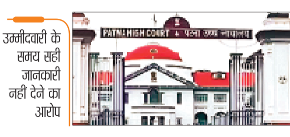
उम्मीदवारी के समय सही जानकारी नहीं देने का आरोप

हाईकोर्ट ने 42 विधायकों को भेजा नोटिस नामांकन में 'सही तथ्य' छिपाने का आरोप, पक्ष-विपक्ष के नेता शामिल